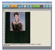
更多扫描设置面板