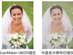
ScanMaker i360扫描仪 中晶低分辨率扫描仪

目前市场主流的4800dpi的分辨率，能使扫描的图像更清晰细致，能将一张普通6寸照片放大至16倍，满足用户对图像的需求，轻轻松松扫出靓丽图像。